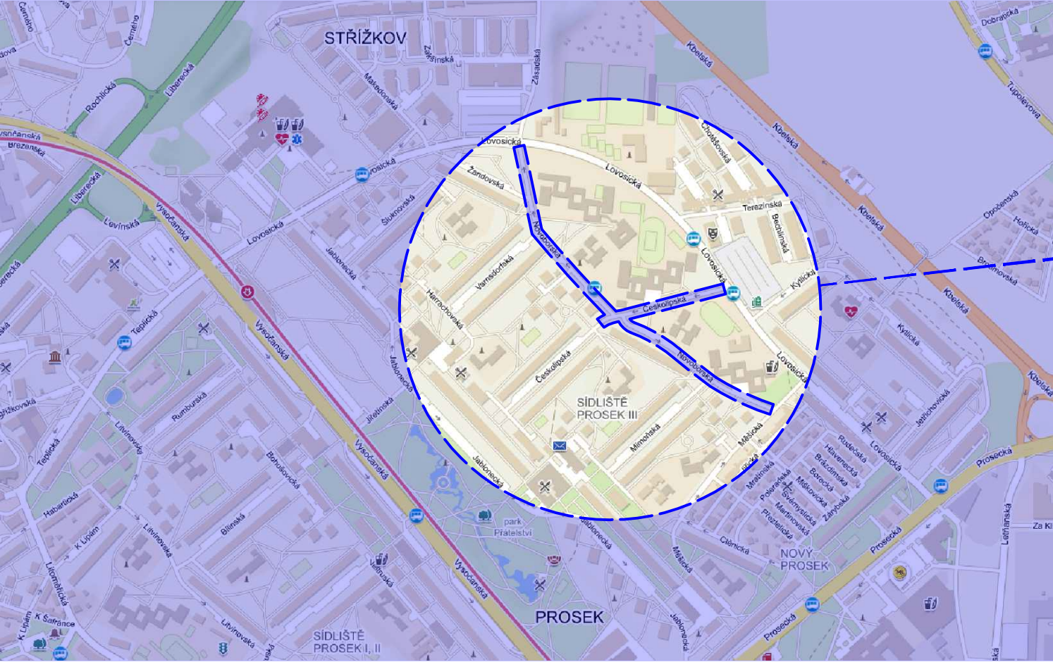
Širší umístění - Část obce: Městská část Praha 9 - Střížkov - Prosek