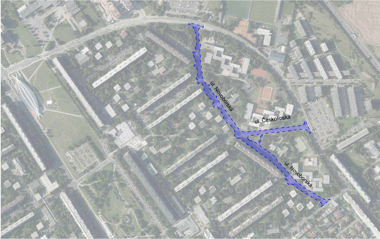
Detail umístění - Ulice: Českolipská - Novoborská

Seznam stavebních objektů SO.001 - Dopravně inženýrská opatření SO.101 - Rekonstrukce a stavební úpravy stávající komunikace SO.301 - Dešťová kanalizace SO.401 - Veřejné osvětlení SO.402 - Přeložka sdělovacího vedení společnosti „Vodafone Czech Republic a.s.“ SO.403 - Přeložka sdělovacího vedení společnosti „T-Mobile Czech Republic a.s.“ SO.801 - Sadové úpravy Koordinovaná výstavba Parkování Novoborská 1 - na pozemcích parc.č. 500/26 a 838/1 v k.ú. Střížkov Parkování Novoborská 2 - na pozemcích parc.č. 838/1 a 500/33 v k.ú. Střížkov Rozšíření sítě sdělovacího vedení společnosti T-Mobile - Vydáno UR (nerealizuje se) (zast. p. Luboš Stříbrný, tel.: +420 739 565 063, email: lubos.stribny@t-mobile.cz) Obnova sítě PRÉdi a.s., stavba S-145835: Obnova KVN a KNN Novoborská od RS 1550 (projektuje Ing. Pavel Nejedlý, tel.: 606 683 388, pavelnejedly@email.cz) Pražská plynárenská Distribuce, a.s., - obnova plynárenského zařízení v lokalitě (osoba pověřená koordinací Ing. Tomeh Tarek, tel.: 607 106 346)